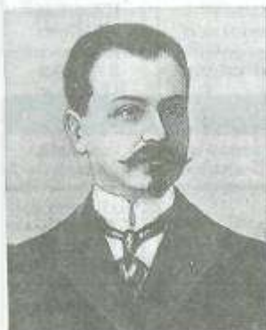
Фатахи хан Хойский