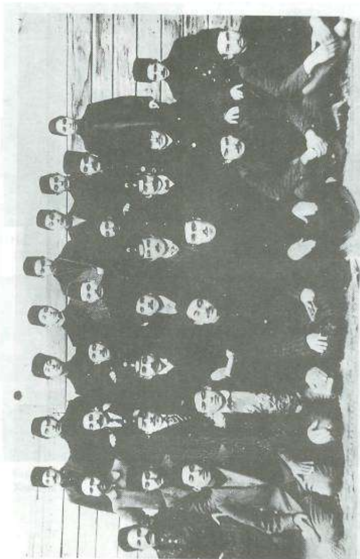
Азербайджанская социал-демократическая организация «Гуммет».