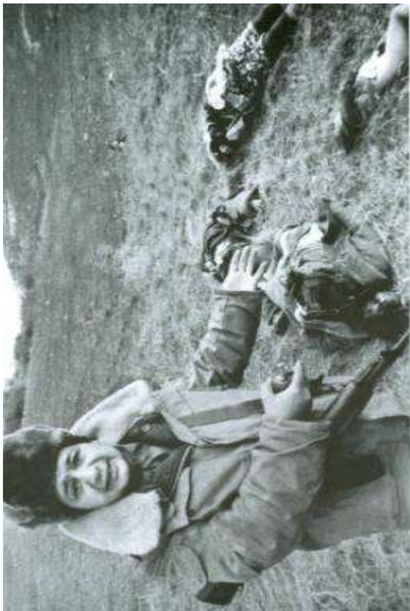
XOCALI: erməni terroruna məruz qalmış bir ailə