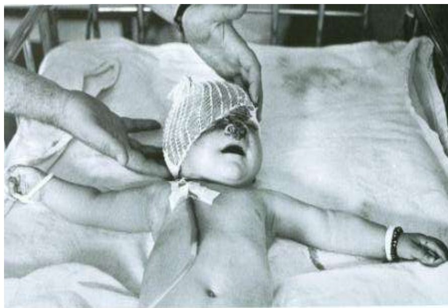
LAÇIN: Terror qurbanı olan körpə