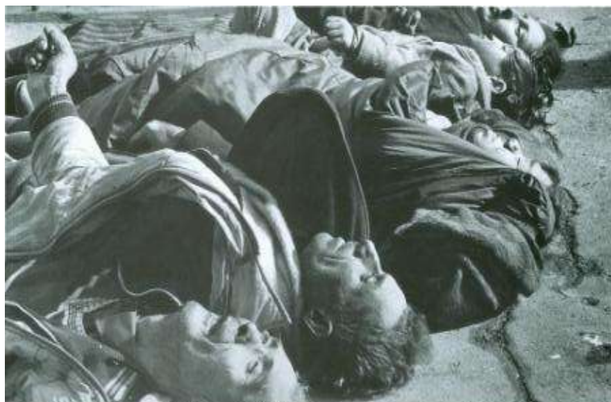
Xocalıda kimyəvi silahlara məruz qalmış azərbaycanlılar