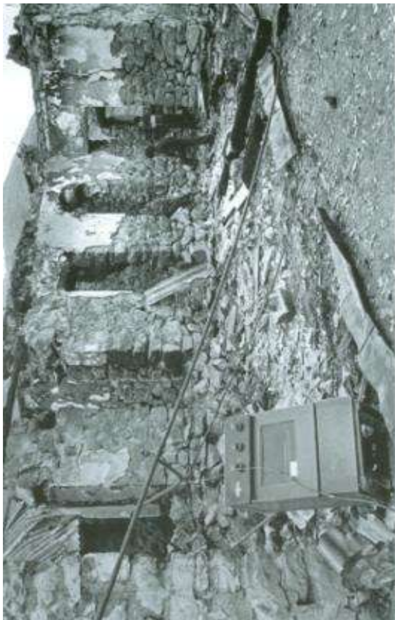
Ermeni işğalçıları tərəfindən dağıdılmış Qubadlı