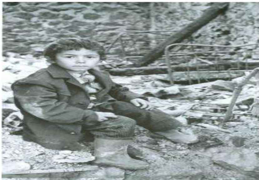
Yurdu erməni terroruna məruz qalmış ailə