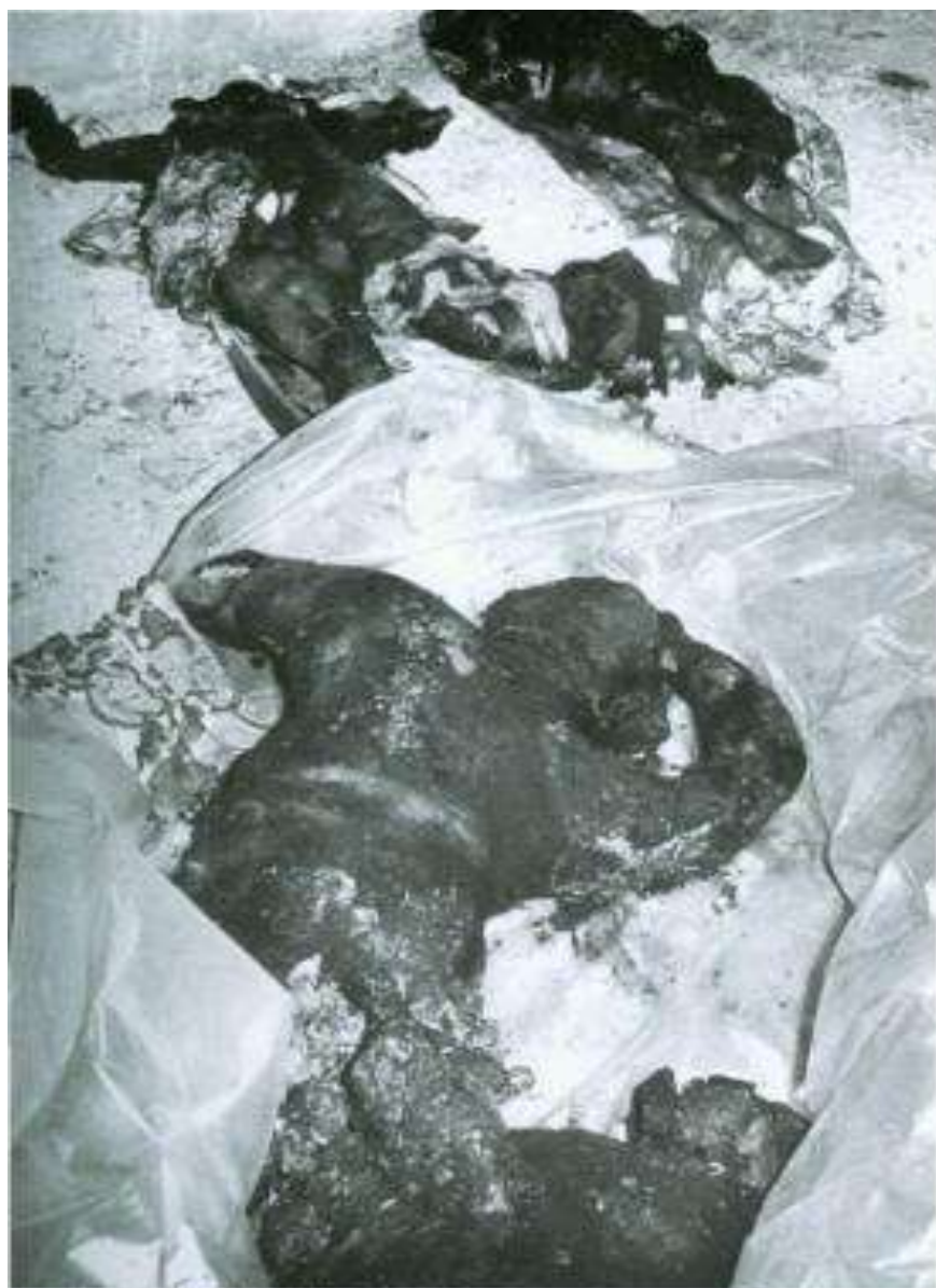
SUŞA: "ASALA" beynəlxalq erməni terror təşkilatının üzvləri tərəfindən yandırılmış ailə