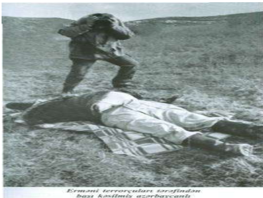
Erməni terrorçuları tərəfindən başı kəsilməy azərbaycanlı