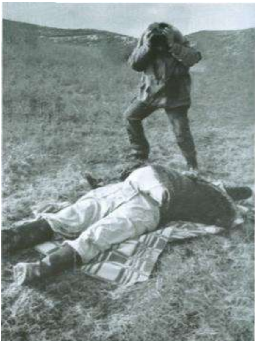
Бүгд биеэнийг хамгаалж байхын тулд тэдгээрийг