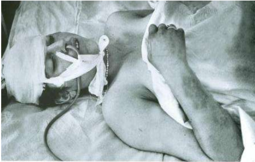
SUSA: övladı gözünün qarşısında erməni terrorçuları tərəfindən güllələnmiş ana